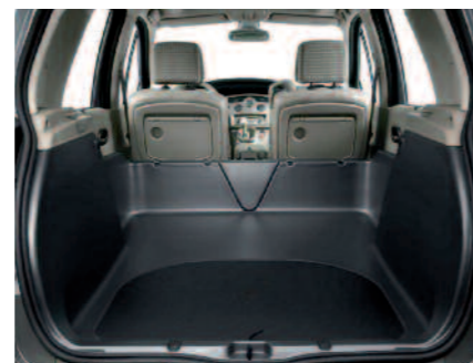
Visuel non contractuel.