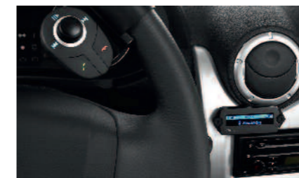
* Pour téléphoner en toute sécurité, il est recommandé d'être à l'arrêt.