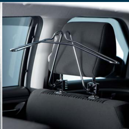
4 | Плечики для одежды крепятся к опорам переднего подголовника, 1 шт. Арт № 990E0-79J89-000