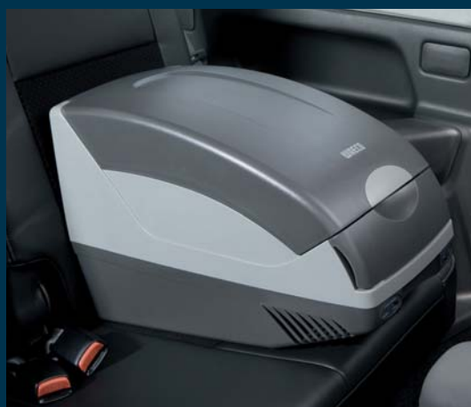
5 | Холодильник* Объем 15 л, можно закрепить ремнем безопасности.