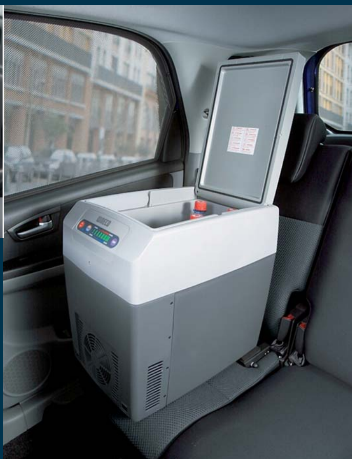
6 | Холодильник* с креплением ISOFIX, объем 21 л.