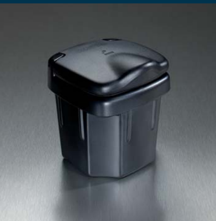
1 | Пепельница Арт. № 89810-86G10-5PK