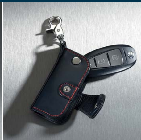
3 | Чехол для ключа с дистанционным управлением черный, натуральная кожа. Арт. № 99000-990X6-A11