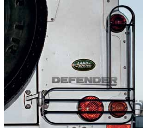
Откидные защитные решетки для фар – задняя пара STC53157