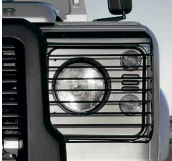
Откидные защитные решетки для фар – передняя пара STC53161